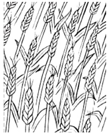
4. leven voor God

De vraag is natuurlijk in welk plaatje jij jezelf herkent. Bespreek dat eens met elkaar in de groep, als je dat aandurft. Maar denk er in ieder geval voor jezelf eens over.