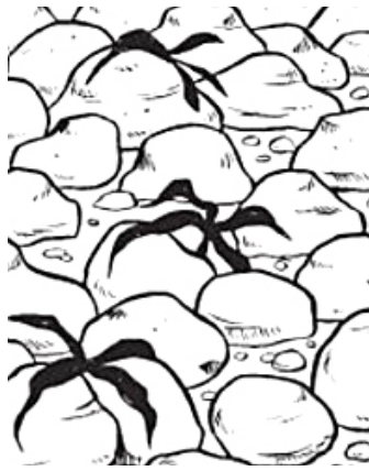
2. de harde steen