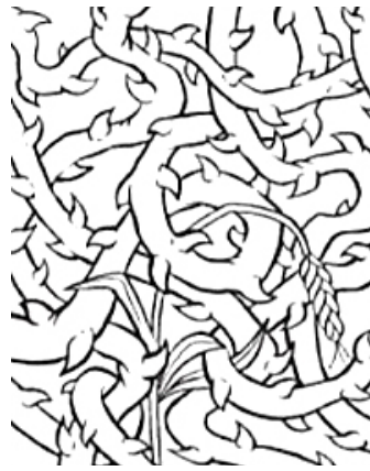
3. de grote drukte