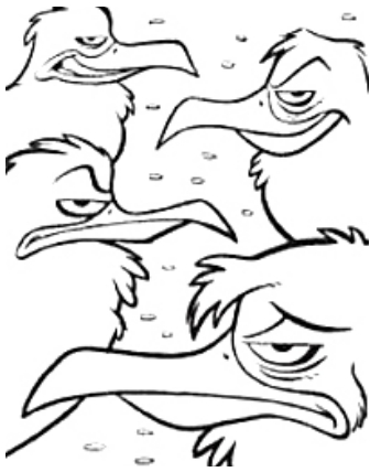
1. het harde pad